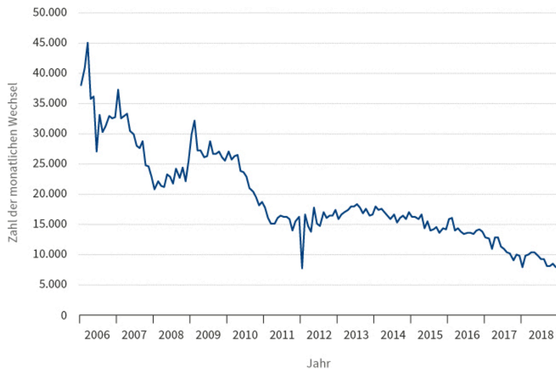
Abb. 2: Saldo der monatlichen Wechsel von der Arbeitslosenversicherung (SGB III) in die Grundsicherung (SGB II)